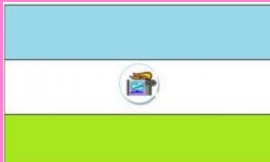
Прапор ДЮГО „Сходинки”